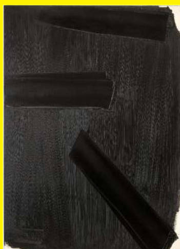
Pierre Soulages Peinture 162x114 cm, 27 février 1979, huile sur toile