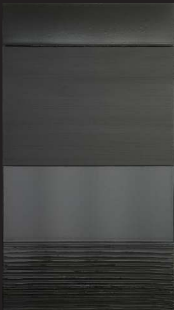
Pierre Soulages, Peinture 324 x 181 cm, 17 mars 2005, huile sur toile