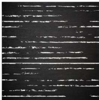
Pierre Soulages Peinture 222 x 222 cm, 1er septembre 2001, huile sur toile