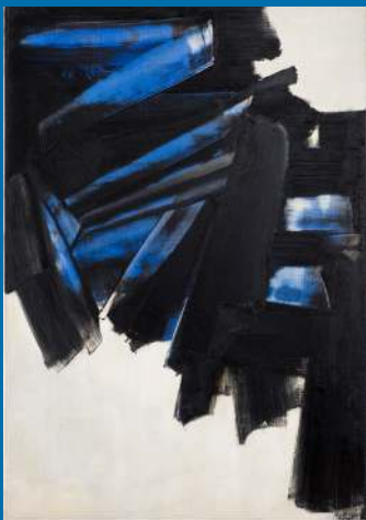
Pierre Soulages, Peinture , 162 x 114 cm, 28 décembre 1959, huile sur toile