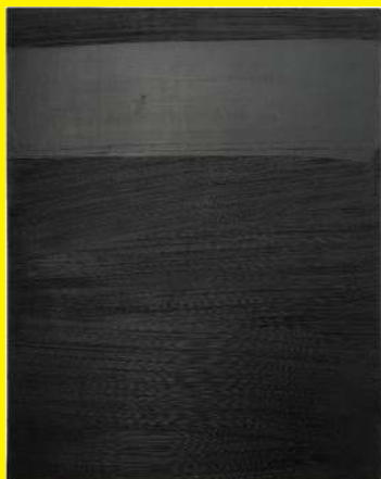
Pierre Soulages Peinture 162x 127 cm, 14 avril 1979, huile sur toile