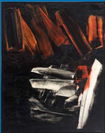
Pierre Soulages, Peinture , 162x 130 cm, 2 novembre 1959, huile sur toile