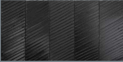
Pierre Soulages Peinture 181 x 405 cm, 12 avril 2012, acrylique sur toile