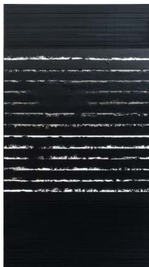
Pierre Soulages Peinture 324 x 181 cm, 8 janvier 2001, huile sur toile