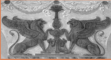
Tommaso Baroffi, Fresque des griffons, 1825/28