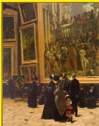
Louis Béroud, Le Salon carré au Musée du Louvre , 1883, huile sur toile