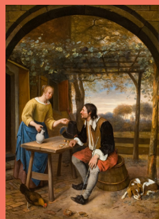
Jan Havicksz Le repos devant l'auberge vers 1660, huile sur toile