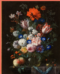
Nicolaes van Veenendaal, Vase de fleurs , 1674, huile sur toile