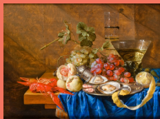
Cornelis de Heem, Nature morte de fruits et de fruits de mer , 1659, huile sur toile