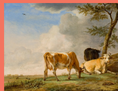
Paulus Potter Trois vaches au pâturage 1648, huile sur toile