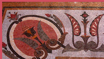
Mosaïques, galerie des colonnes, 1878