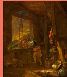
Willem Kalf Intérieur d'un auberge vers 1646, huile sur toile