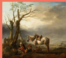
Philips Wouwerman Le repos du laboureur vers 1646-1648, huile sur toile