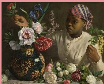
Frédéric Bazille, La jeune femme aux pivoines , 1870, huile sur toile

Vous pouvez aussi effectuer cette activité devant cette œuvre :