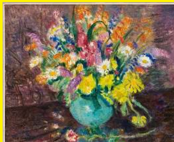
Charles Camoin, Fleurs , 20 ème siècle, huile sur toile

Vous pouvez aussi effectuer cette activité devant cette œuvre :