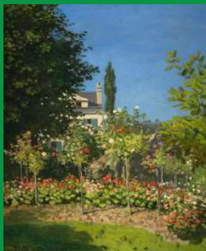
Claude Monet, Jardin en fleurs à Sainte-Adresse , 1856, huile sur toile

Vous pouvez aussi effectuer cette activité devant cette œuvre :