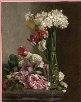
Frédéric Bazille, Fleurs , vers 1869-70, huile sur toile

Vous pouvez aussi effectuer cette activité devant cette œuvre :