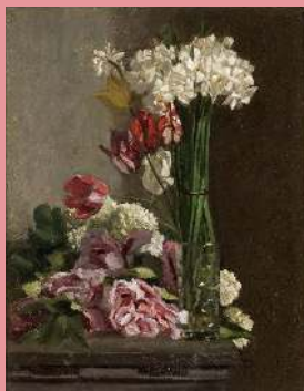
Frédéric Bazille, Fleurs , vers 1869-70, huile sur toile

Vous pouvez aussi effectuer cette activité devant cette œuvre :