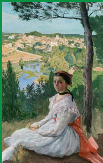
Frédéric Bazille, La vue de village , 1868, huile sur toile

Vous pouvez aussi effectuer cette activité devant cette œuvre :