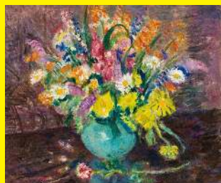
Charles Camoin, Fleurs , 20 ème siècle, huile sur toile

Vous pouvez aussi effectuer cette activité devant cette œuvre :