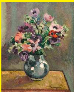
Charles Manguin, Anémones , huile sur toile

Vous pouvez aussi effectuer cette activité devant cette œuvre :