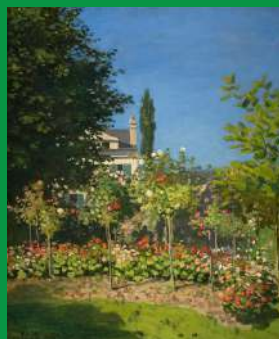
Claude Monet, Jardin en fleurs à Sainte-Adresse , 1856, huile sur toile

Vous pouvez aussi effectuer cette activité devant cette œuvre :