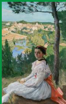
Frédéric Bazille, La vue de village , 1868, huile sur toile

Vous pouvez aussi effectuer cette activité devant cette œuvre :