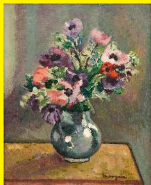
Charles Manguin, Anémones , huile sur toile

Vous pouvez aussi effectuer cette activité devant cette œuvre :