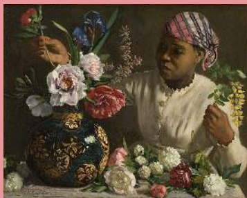
Frédéric Bazille, La jeune femme aux pivoines , 1870, huile sur toile

Vous pouvez aussi effectuer cette activité devant cette œuvre :