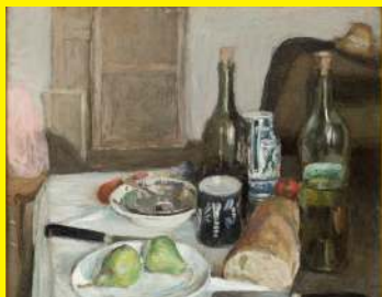
Henri Matisse, Nature morte aux couteaux noirs , 1896, huile sur toile

Vous pouvez aussi effectuer cette activité devant cette œuvre :