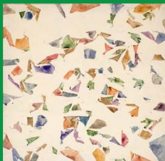
Simon Hantai, Blanc , 1974, huile sur toile

Vous pouvez aussi effectuer cette activité devant cette œuvre :