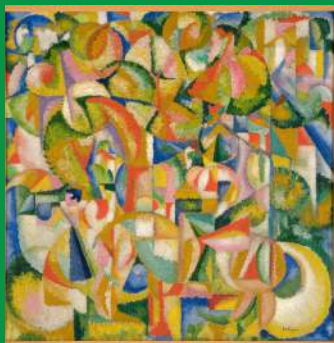
Amadeo de Souza-Cardoso Les cavaliers , 1913, huile sur toile Dépôt du Centre Pompidou

Vous pouvez aussi effectuer cette activité devant cette œuvre :