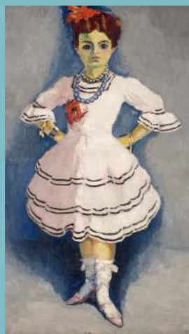
Kees Van Dongen Danseuse espagnole , 1912, huile sur toile

Avant de réaliser l'activité manuelle, observez ce portrait :