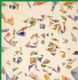
Simon Hantai, Blanc , 1974, huile sur toile

Vous pouvez aussi effectuer cette activité devant cette œuvre :