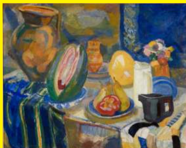
Robert Delaunay, Nature morte portugaise , 1915, huile sur toile

Vous pouvez aussi effectuer cette activité devant cette œuvre :