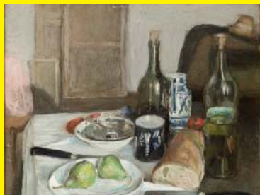
Henri Matisse, Nature morte aux couteaux noirs , 1896, huile sur toile

Vous pouvez aussi effectuer cette activité devant cette œuvre :