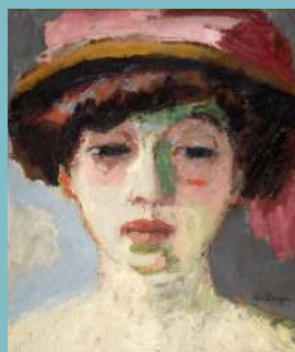
Kees Van Dongen, Fernande Olivier , 1907, huile sur carton

Avant de réaliser l'activité manuelle, observez ce portrait :