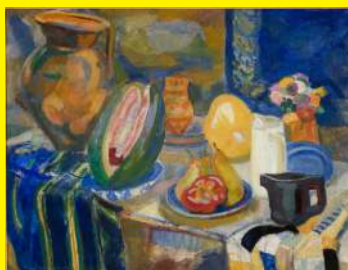
Robert Delaunay, Nature morte portugaise , 1915, huile sur toile

Vous pouvez aussi effectuer cette activité devant cette œuvre :