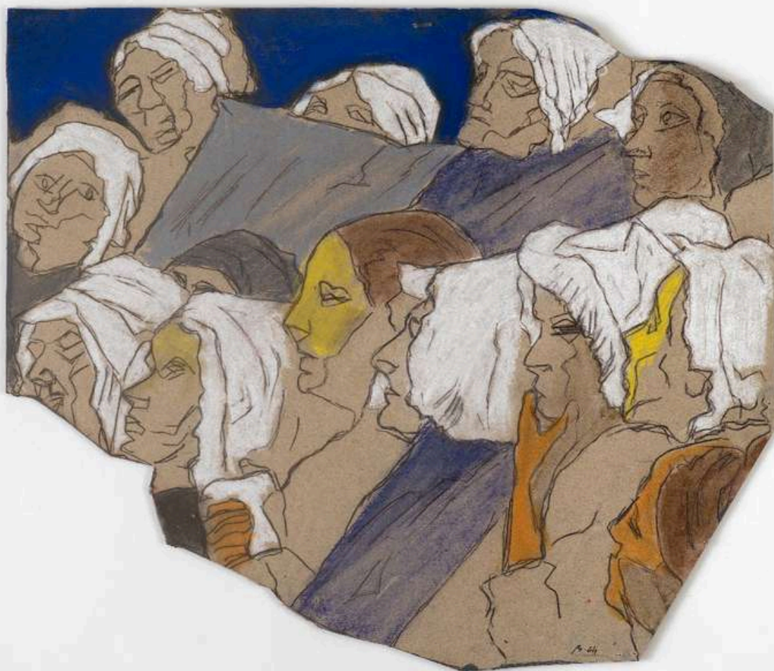
Pierre Buraglio, D'après... Max Leenhardt, Étude pour prisonnières , 2024, pastel, découpage, 41 × 47 cm, collection de l'artiste, © photographie Alberto Ricci / © Adagp, Paris, 2024. Reproduction interdite sans autorisation.