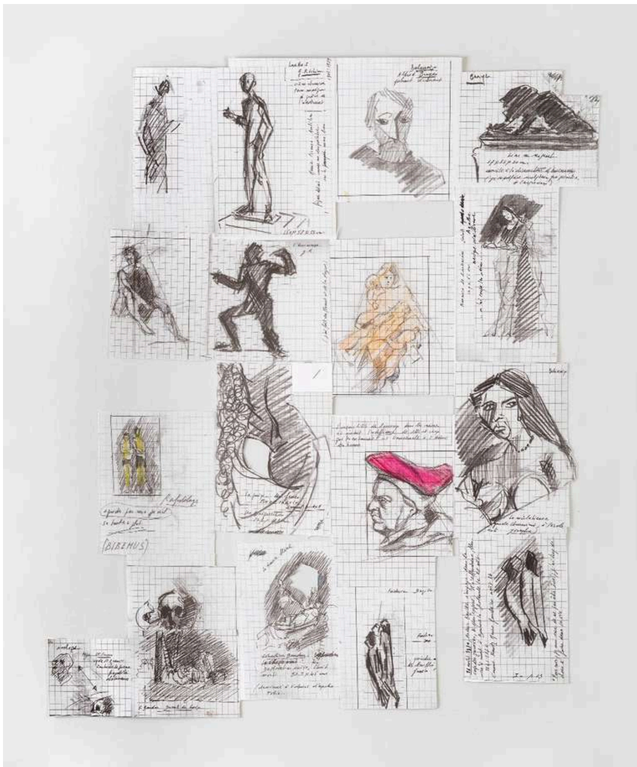
Pierre Buraglio, montage de croquis, 2009, infographie, 79 × 61 cm, collection de l'artiste, © photographie Alberto Ricci / © Adagp, Paris, 2024. Reproduction interdite sans autorisation.