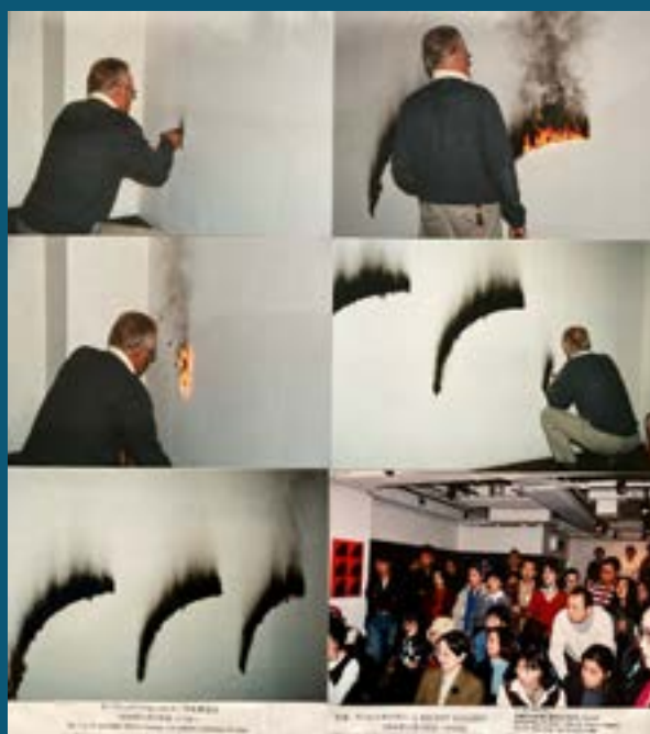
Christian Jaccard, Tableau éphémère , 1994, Recent Gallery, Sapporo.

EXPLOITATION : Les élèves retrouvent les formes géométriques créées par leurs camarades. Une sensibilisation aux produits du quotidien et leurs dangers, que ce soit dans les mélanges ou les combustions.