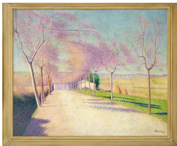
Achille Laugé, La route au lieu-dit de « l'Hort », vers 1896-1898