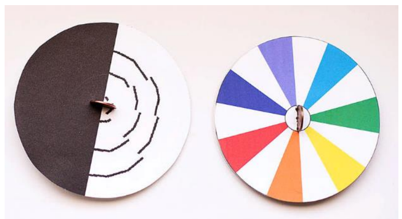
Exemples de toupie « effet d'optique »