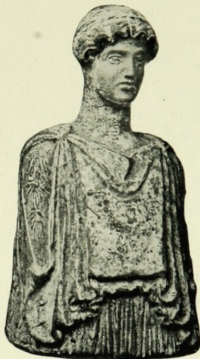
BUSTE DE CORÉ.

Terre cuite de Tanagra, offerte à L. Heuzey par ses amis et donnée par lui au musée du Louvre.