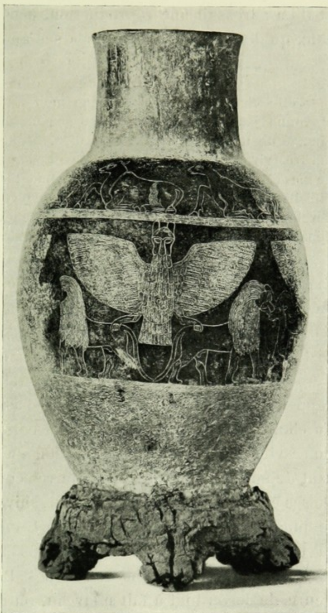
LE VASE D'ARGENT D'ENTÉMÉNA.

Ces souvenirs-là et d'autres encore hantaient l'esprit de quelques-